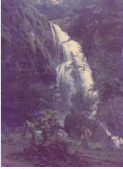
शिवथर घळचा धबधबा

६. कुबडीतीर्थ :- शिंगणवाडी जवळच एक ७-८ किलोमीटर हे 'कुबडी तीर्थ' आहे. शिवाजीराजासाठी हे तीर्थ निर्माण केल्याचे सांगतात. येथे समर्थांच्या भेटीकरिता राजे आले असतांना ते दमले होते, त्यांना तहान लागली होती. त्यासाठी समर्थांनी कुबडीने दगड उलटून तेथून पाण्याची संतत धार निर्माण केली. धारेखाली कुंड आहे.