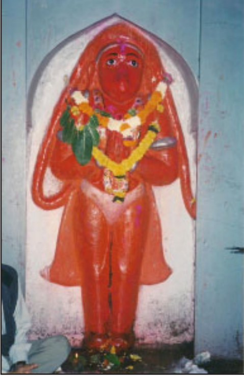
दास मारुती चाफळ