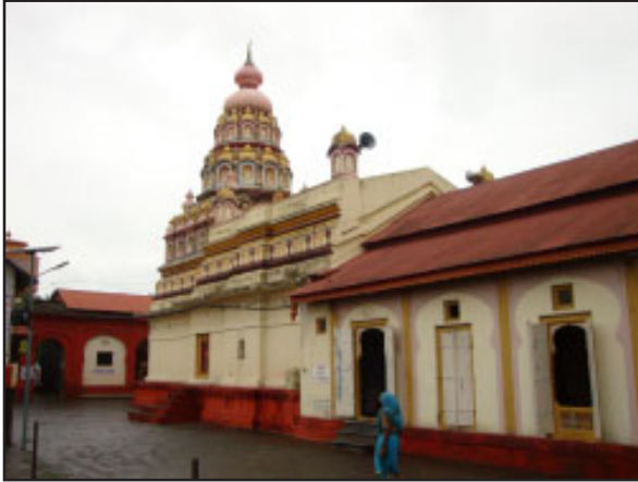
श्री समर्थांची समाधी - सज्जनगड

‘चाफळचा मठ’ हा आद्य मठ म्हणविला जातो. तो शके १५८२ मध्ये झाला. येथून समर्थांनी सर्व देशभर श्रीरामसंप्रदायाची सूत्रे हालविली. ही समर्थांची कर्मभूमि म्हणविते.